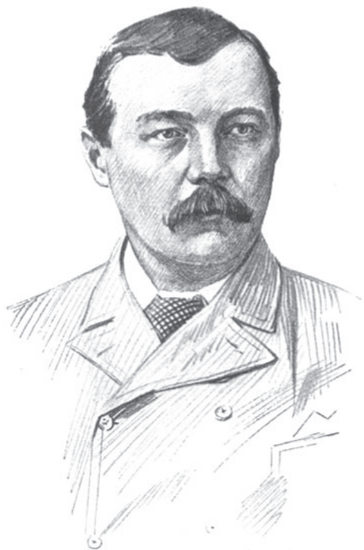
A Conan Doyle